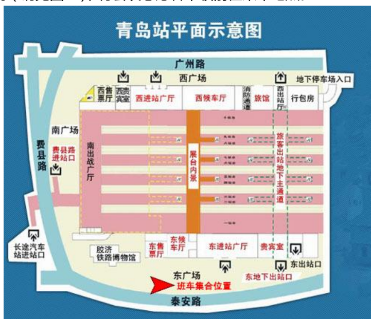
图 2. 青岛站乘车集合地点示意图（仅限 2018 年 10 月 18 日）